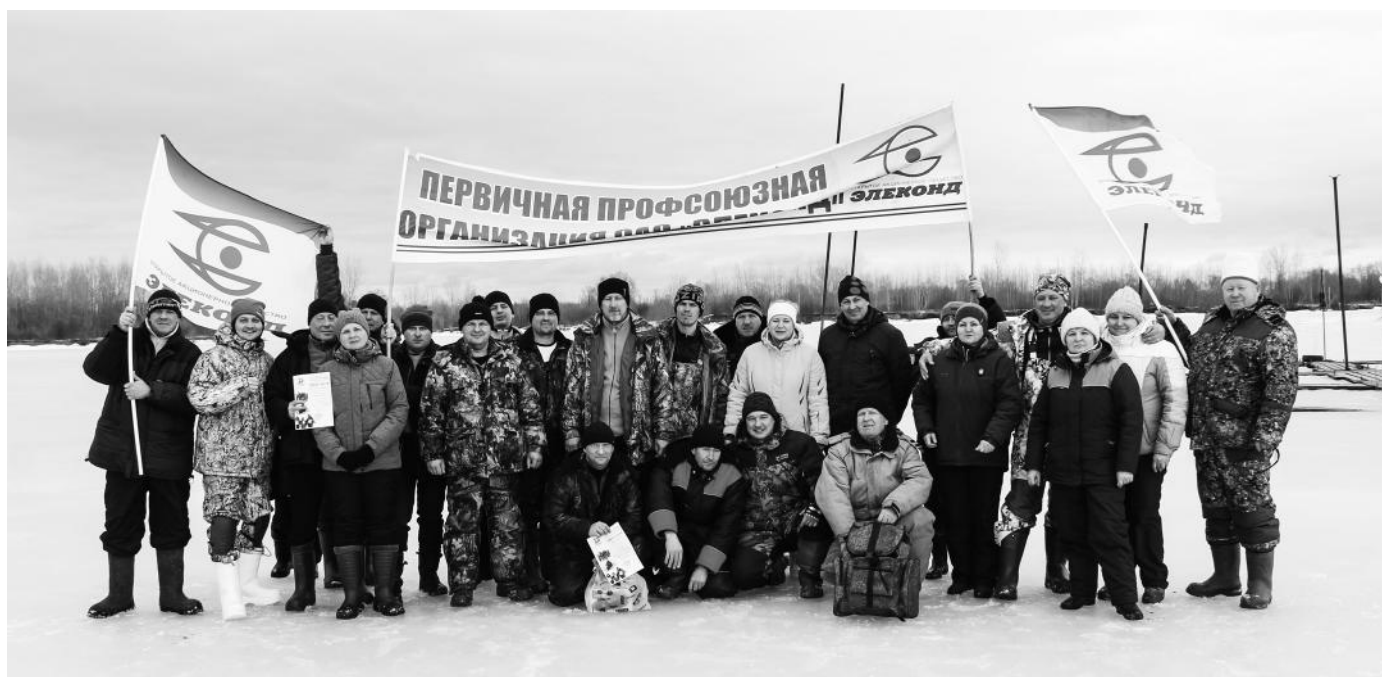
Организаторы, судьи, участники зимней рыбалки 2020 года